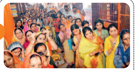
माता को चुनरी और भोग चढ़ाकर ....